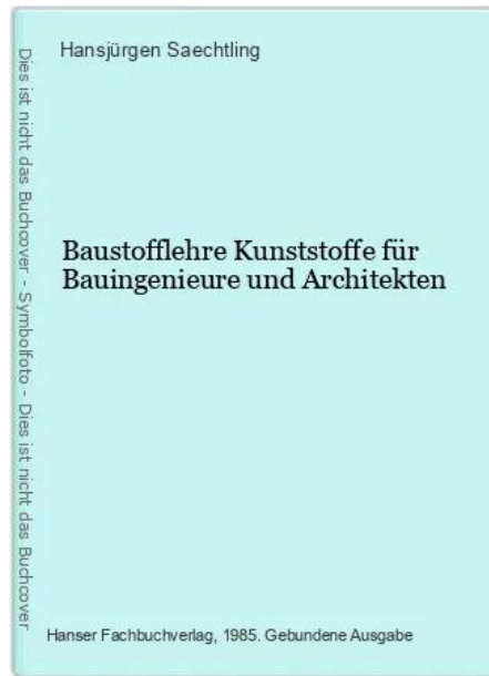
Baustofflehre Kunststoffe... 1985