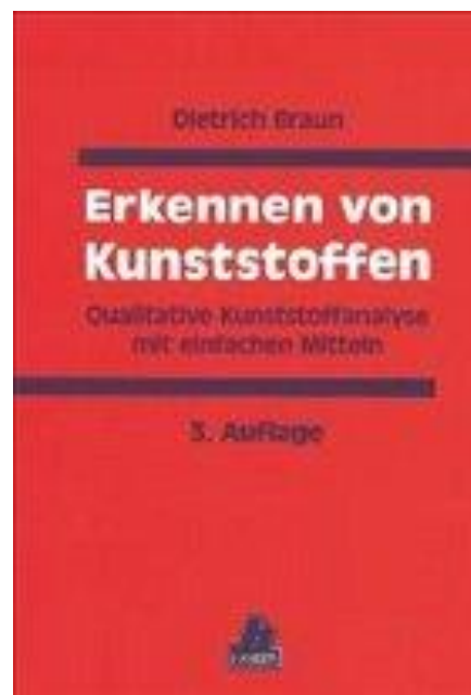
Coautor: H. Saechtling 1982