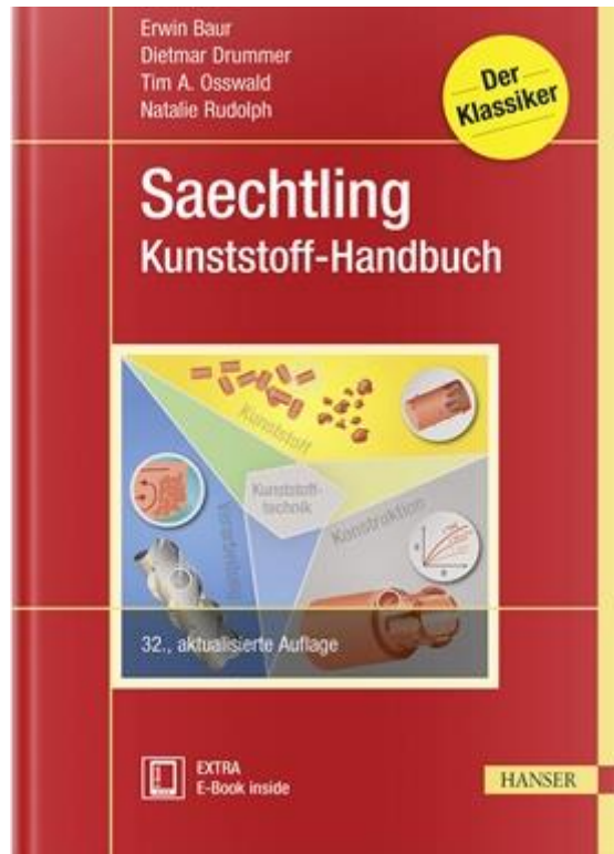
32. Auflage von 2022