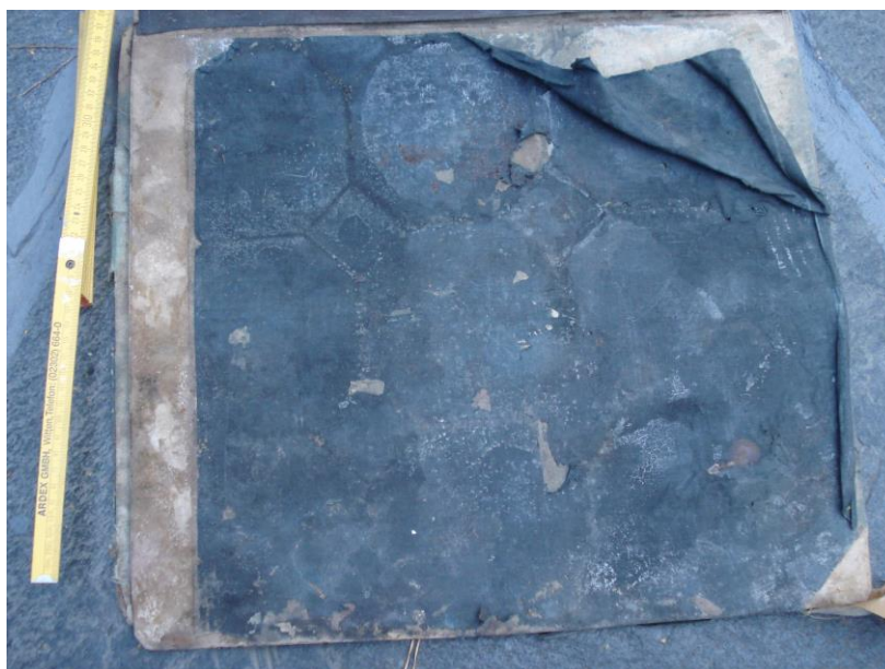
Rückseite des verschimmelten Folianten

Der Anlieferungszustand war desolat; er war offensichtlich auf einen länger zurückliegenden Wasserschaden zurückzuführen.