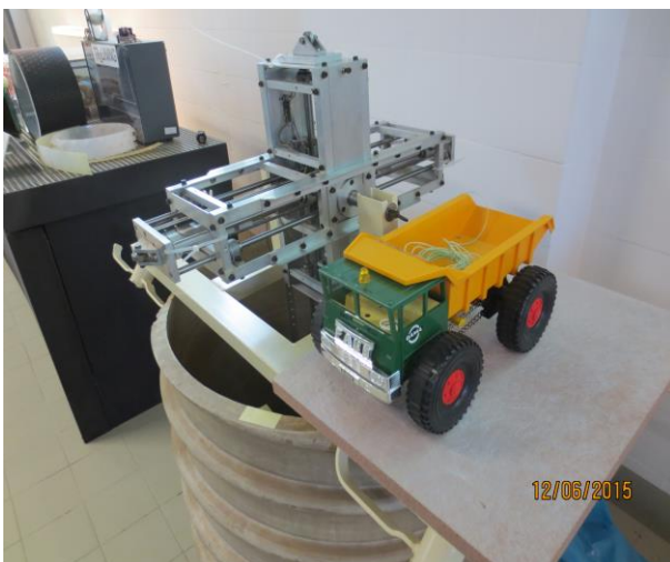
Original mit „Schlepp“-Spielzeugauto

Es besteht aus einem drehbar-gelagerten Messkreuz mit induktiven Messfühlern, welches auf einem Transportwagen so montiert ist, dass seine Achse genau in der Rohrachse liegt. Die höhenverstellbare Achse des Messkreuzes lässt die Kontrolle von Rohren zwischen 600 und 1000 mm Innendurchmesser zu. Der Transportwagen läuft nicht auf Rädern sondern auf Kugeln, die es ermöglichen, dass das Messgerät bei Auslenkungen, unterstützt durch ein Bleigewicht -der Schwerkraft folgend-, immer wieder in der tiefst-möglichen Spur im Innenrohr rollt. Damit ist gewährleistet, dass der Rohr-Innendurchmesser im Scheitel und Kämpfer des Rohres gemessen wird. Wie sein Einsatz gezeigt hat, ermitteln die Fühler den Rohr-Innen-durchmesser in vertikaler und horizontaler Richtung mit einer maximalen Abweichung von 10 mm. Die Messgenauigkeit der Fühler beträgt 0,1 mm. Der Messwagen wird über ein Drahtseil, das mit einem batteriebetriebenen Spielzeugauto vorher durch den zu prüfenden Rohrabschnitt gezogen wird, von einer Antriebswinde mit einer konstanten Geschwindigkeit von 2 m/s durch das Rohr gezogen. Über Kabel werden die Signale der induktiv-arbeitenden Messfühler an das Datenerfassungsgerät übertragen. So wird der Innenrohr-Verformungsverlauf über die gesamte Länge des Rohrabschnitts aufgezeichnet.