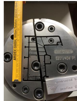
Austrittsöffnung Außendurchmesser: 18 cm