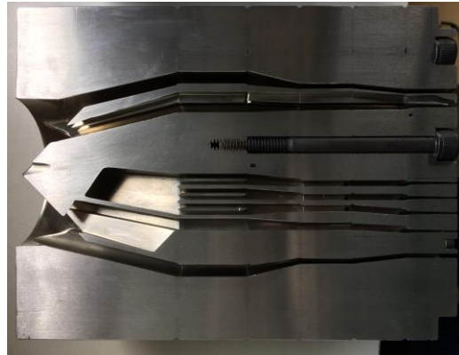
aufgeschnittenes Inneres des Werkzeugs Länge: 24 cm