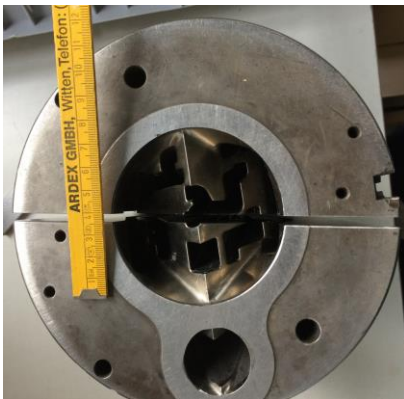
Eintrittsöffnung des Werkzeugs am Extruder Innen-Durchmesser: 80 mm Außendurchmesser: 18 cm