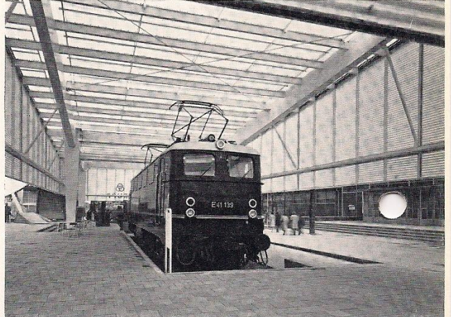
Repräsentative Vielweckhalle, für Messen und Ausstellungen geeignet

Großflächig verlegt, sind TRONEX-Polyester-Wellbahnen nicht nur zweckmäßig, sondern auch besonders eindrucksvoll in Farbe und Gestaltung. Sie werden ihre Werbewirksamkeit nicht verfehlen.