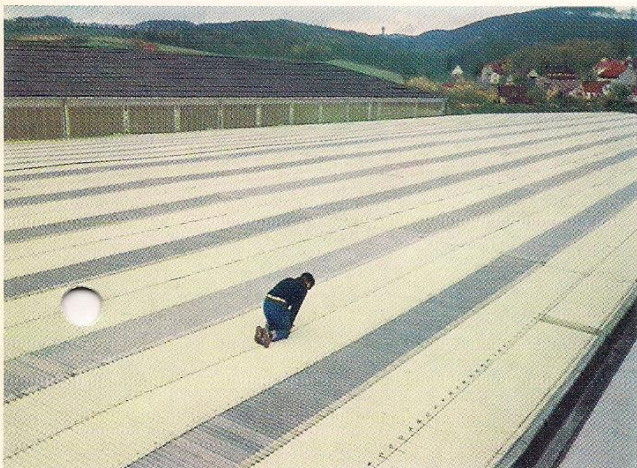
Kombinierte Verlegung weiß-opak und natur-transparent, ca. 5000 qm Fläche