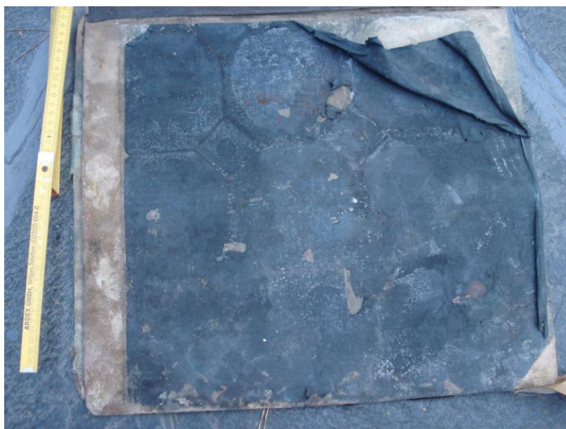
Rückseite des verschimmelten Folianten

Der Anlieferungszustand war desolat; er war offensichtlich auf einen länger zurückliegenden Wasserschaden zurückzuführen.