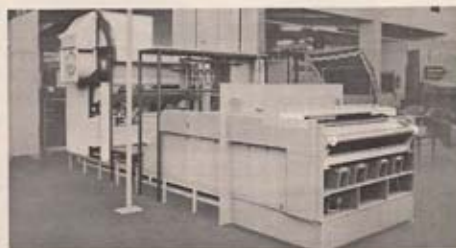
Bild 4 Aqua Color Großbild- und Rollenentwicklungsmaschine (Walter Hostert pers.)