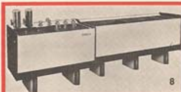
Bild 8 Fribo - X1 Entwicklungs- und Wässerungsanlage aus Trovidur (Heinrich Frings) Bild 9 und 10 Röntgen-Entwicklungseinheiten aus Trovidur (Buck & Sohn) Bild 11 und 12 Fotolabor-Einrichtung mit Metofix-Entwicklungsschalen, Wässerungsgeräten, Metofix-Fixiergeräte aus Trovidur (Meteor) Bild 13 Rotationsentwicklungsmaschine Metorette 110 (Meteor)