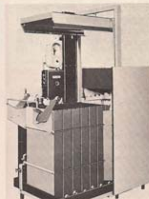
Bild 6 Negativ-Entwicklungsmaschine Fribon Negamat SW 60 (Heinrich Frings)