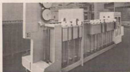
Bild 3 Hostert Automata – Continuous-Filmentwicklungs- maschine aus Trovidur (Walter Hostert pers.)