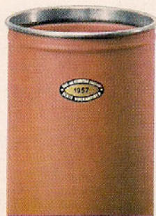
Blechkopfwulstring nach außen (nietlos befestigt)