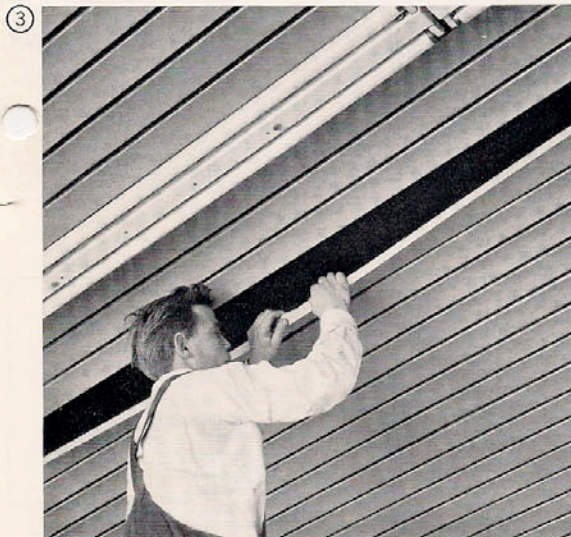
③ Beim starren System werden die TROCAL-Deckenprofile von einer Seite in die Ausklinkungen der Z-Schiene eingehängt und durch Auseinanderziehen des Profils in die andere Ausklinkung eingerastet.