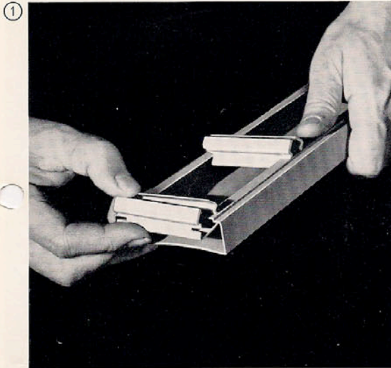
① Beim justierbaren System werden zunächst die Klipps in die Profile eingeschoben.

Nach Montage des Abhänge- und Befestigungssystems werden die TROCAL-Deckenprofile auf die Befestigungsschienen aufgerastet.