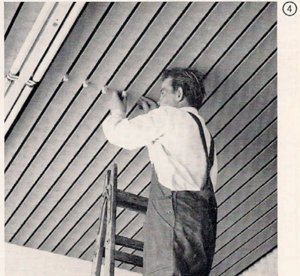
④ Das Ausrichten der Profile beim justierbaren System erfolgt durch Einlegen von Abstandklötzchen zwischen die Profile. Dann werden die Profile herangeschoben, die Klötzchen entfernt und in die nächsten Fugen eingesteckt.