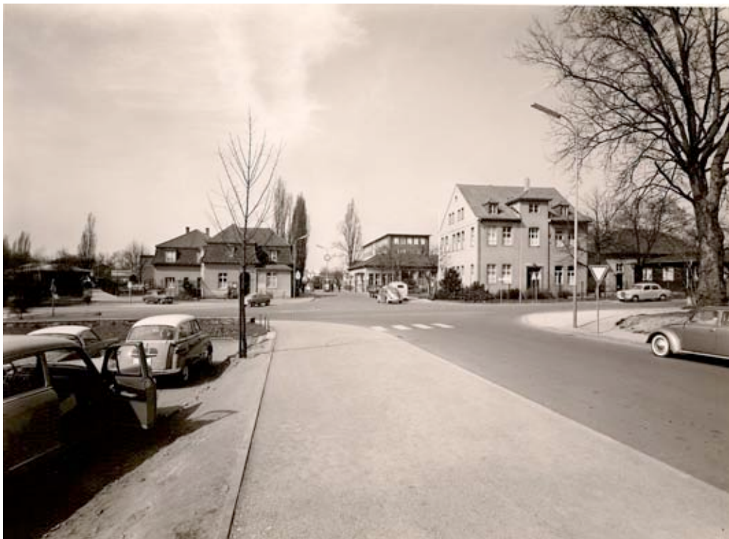
Blick auf Tor I, Kaiserstraße, vor dem Neubau (1960)